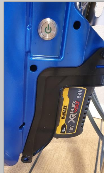
Dewalt Flexvolt batteri 6AH tar 1 timme att återladda.