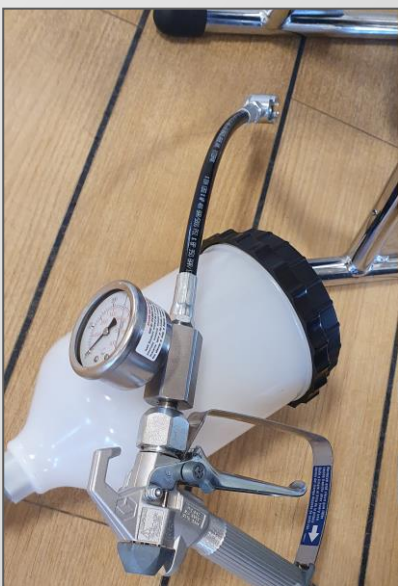
Behållare 2 liter ingår.