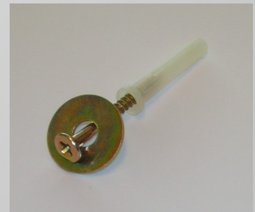
Betongspik m/skiva (ingår ej)